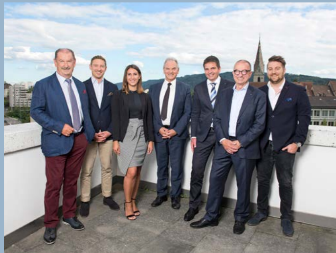
2018 übernahm nach 72 Jahren des Bestehens die dritte Generation die Verantwortung.